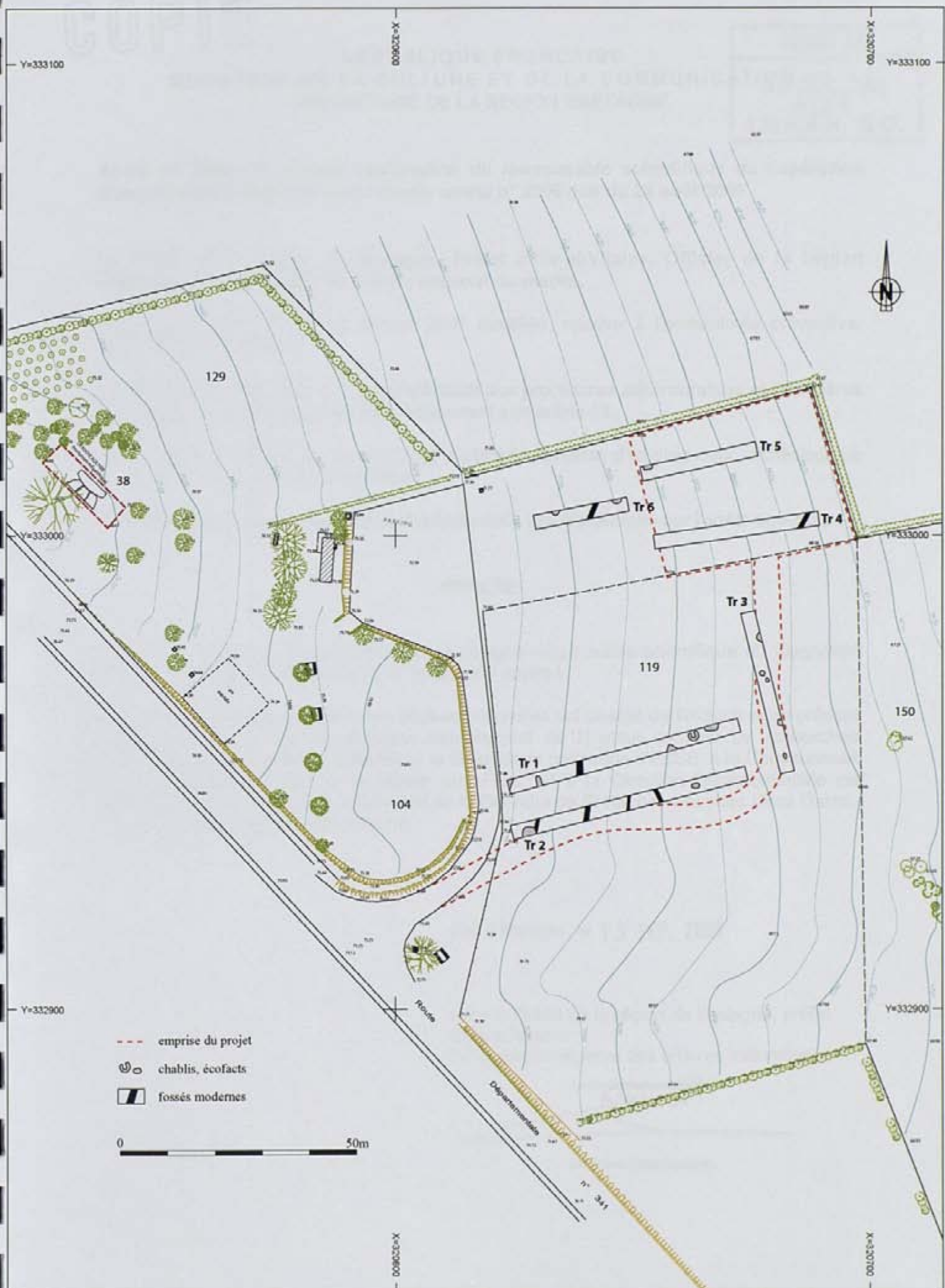
Figure 2 : Localisation des tranchées de diagnostic sur le plan cadastral au 1/1000è.